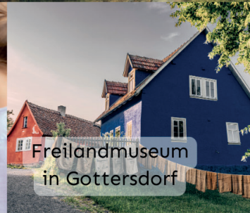
Freilandmuseum in Gottersdorf