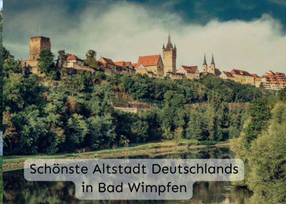
Schönste Altstadt Deutschlands in Bad Wimpfen