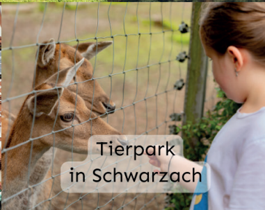
Tierpark in Schwarzach