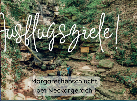
Margarethenschlucht bei Neckargerach