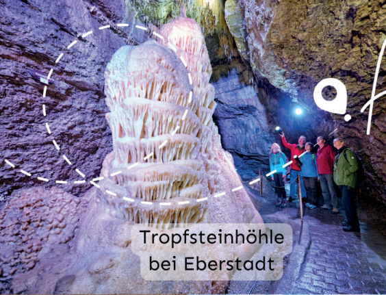
Tropfsteinhöhle bei Eberstadt