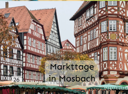
Markttage in Mosbach