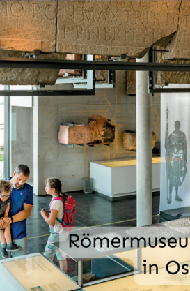
Römermuseum und Limesturm in Osterburken